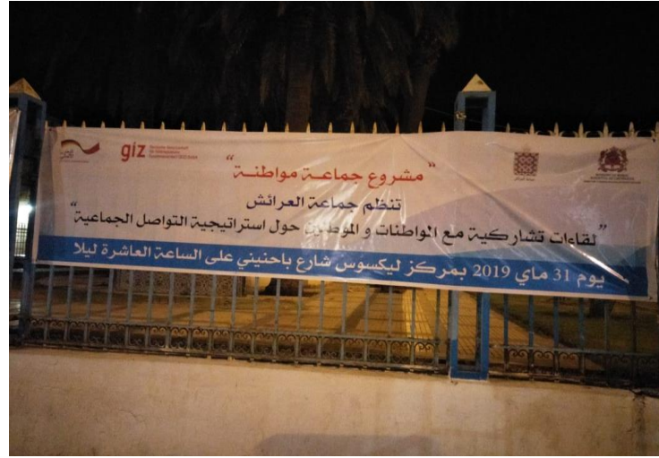
محضر مخرجات اللقاءات التشاركية